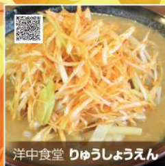
洋中食堂 りゅうしょうえん