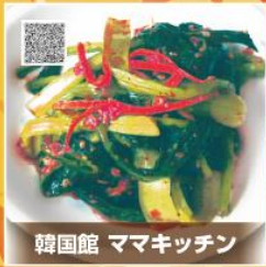
韓国館 ママキッチン