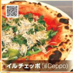
イルチェッポ (Il Ceppo)