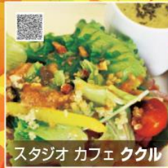
スタジオ カフェ ククル