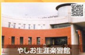
やしお生涯楽習館