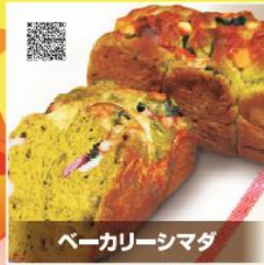
ベーカリーシマダ