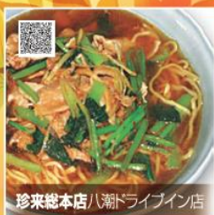
珍来総本店 八潮ドライブイン店