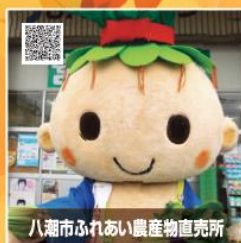
八潮市ふれあい農産物直売所