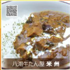
八潮牛たん屋 米州