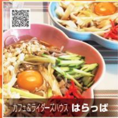
カフェ&レストランズ はらっぱ