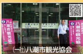
(一社)八潮市観光協会